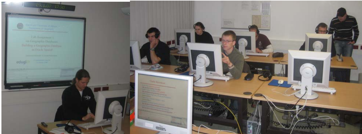
Abb. 3.: Tutor und Studenten während einer Sitzung

Die Kurse, die jedes der Partnerinstitute erhält, müssen so ausgewählt werden, dass sie sich zeitlich und thematisch in den Studienplan integrieren lassen und diesen sinnvoll ergänzen, was in der Praxis in unterschiedlichen Ländern mit unterschiedlichen Semesterzeiten und Curricula nicht immer einfach ist. Im Rahmen des eduGI Projektes erhalten die Studenten der Universität der Bundeswehr von der Harokopio Universität Athen einen Kurs über Geodatenbanken und von der Universität Münster einen Kurs zum Thema Projektmanagement. Letzterer ist derzeit im Gange, so dass hier nur als Zwischenbilanz erwähnt werden kann, dass er bisher einen positiven Zuspruch findet.